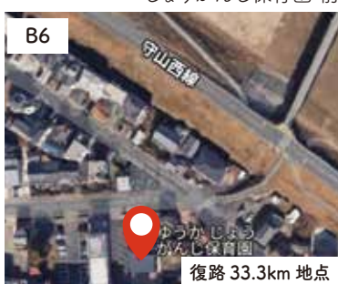
7 じょうがんじ保育園 前