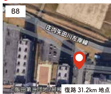
6 上飯田第二団地2号棟 東