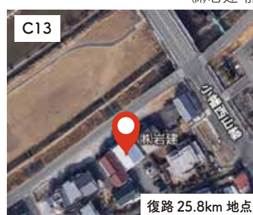
3 (株)岩建 前