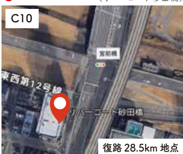
5 宮前橋南側道 (リバーコート砂田橋)