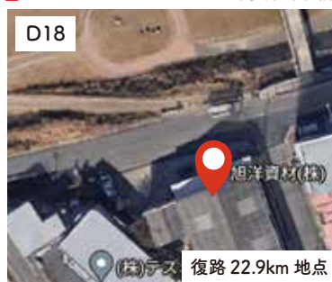
2 旭洋資材(株) 前